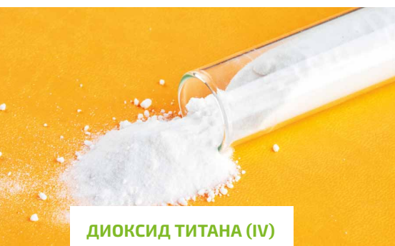
ДИОКСИД ТИТАНА (IV)

Разбавленные растворы (около 0,1%) перманганата калия применяют в медицине как антисептическое средство — ими промывают раны и обрабатывают ожоги. Продукт используют в качестве рвотного средства при отравлении некоторыми веществами.