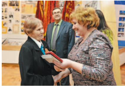
Вручение наград в музее ГК «Титан»

Оригиналы обязательно будут возвращены владельцам!