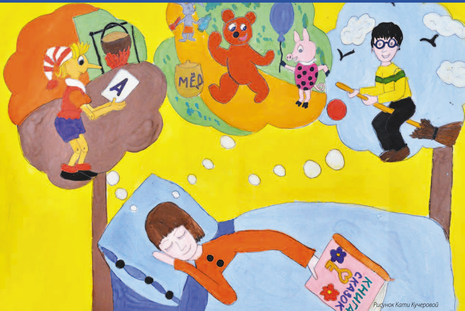
Рисунок Кати Кучеровой