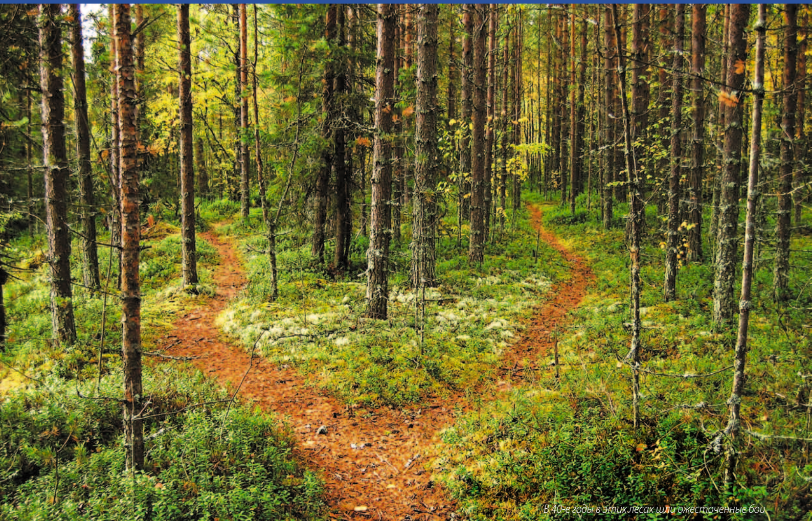
В 40-е годы в этих лесах шли ожесточенные бои