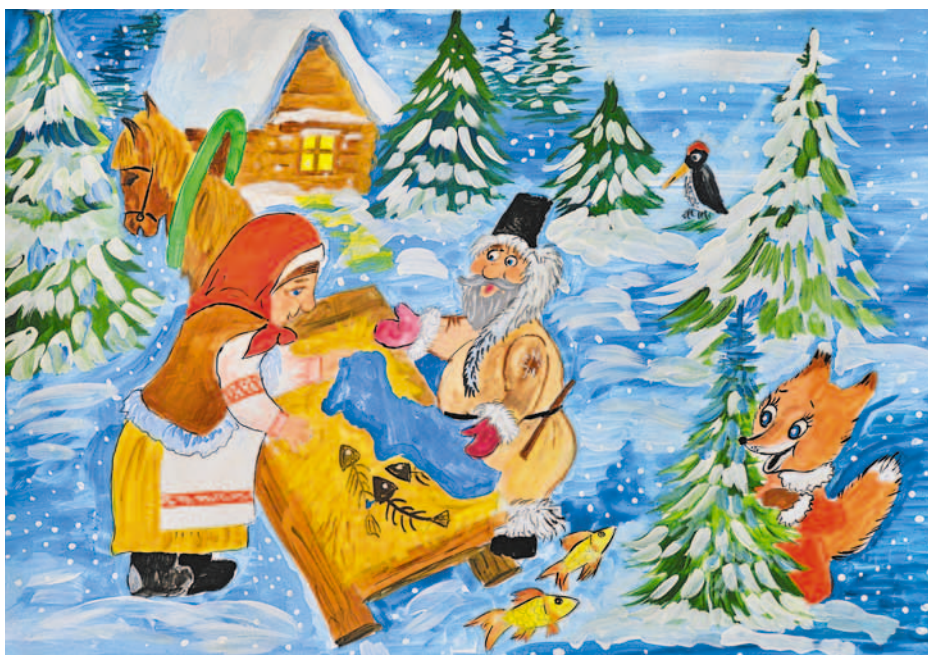
Рисунок Миши Масалова