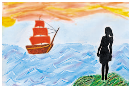
Рисунок Полины Ниязаевой