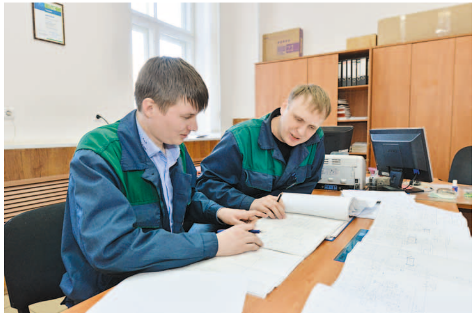
Обсуждение технологических схем

«Для того чтобы приносить максимальный эффект в условиях общего