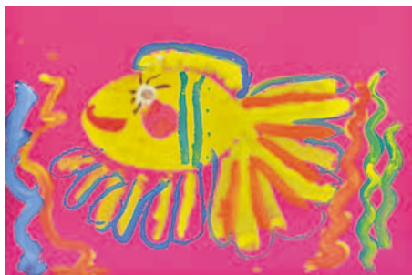
Рисунок Вари Агабабян