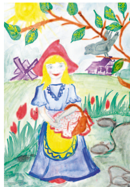
Рисунок Вали Исаевой