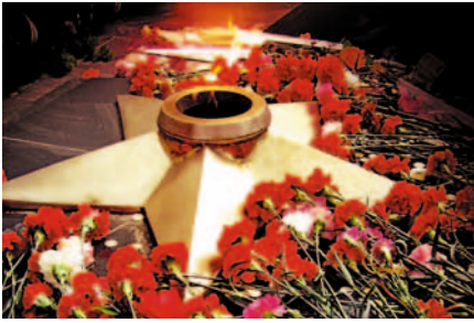
Поклонимся и мертвым, и живым