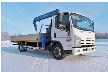
Isuzu в чистом поле