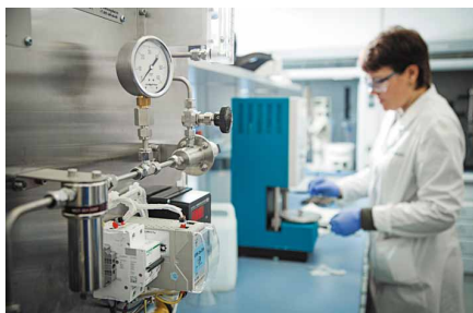
НИОСТ: измерение прочности цеолитов