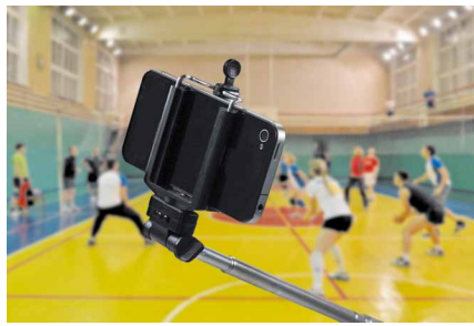
В объективе – спорт