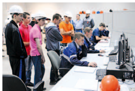
Экскурсия в профессию

В июне в рамках реализации проекта «Тропинками ПАРКа» площадки нефтехимического кластера посещали студенты средних профессиональных и высших учебных заведений. Обогатились знаниями студенты-первокурсники Омского промышленно-экономического колледжа и нефтехимического института ОмГТУ. Кроме того, проекты ГК «Титан» вызвали неподдельный интерес студентов 4 курса географического факультета Московского государственного педагогического университета, которые прибыли в наш регион на практику.