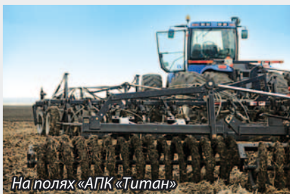
На полях «АПК «Титан»

* Беконная свинина – это мясо поросенка от 6 до 8 месяцев с толщиной шпика 2-4 см. Небольшой полив жира на кусочках свинины придает им особую сочность.