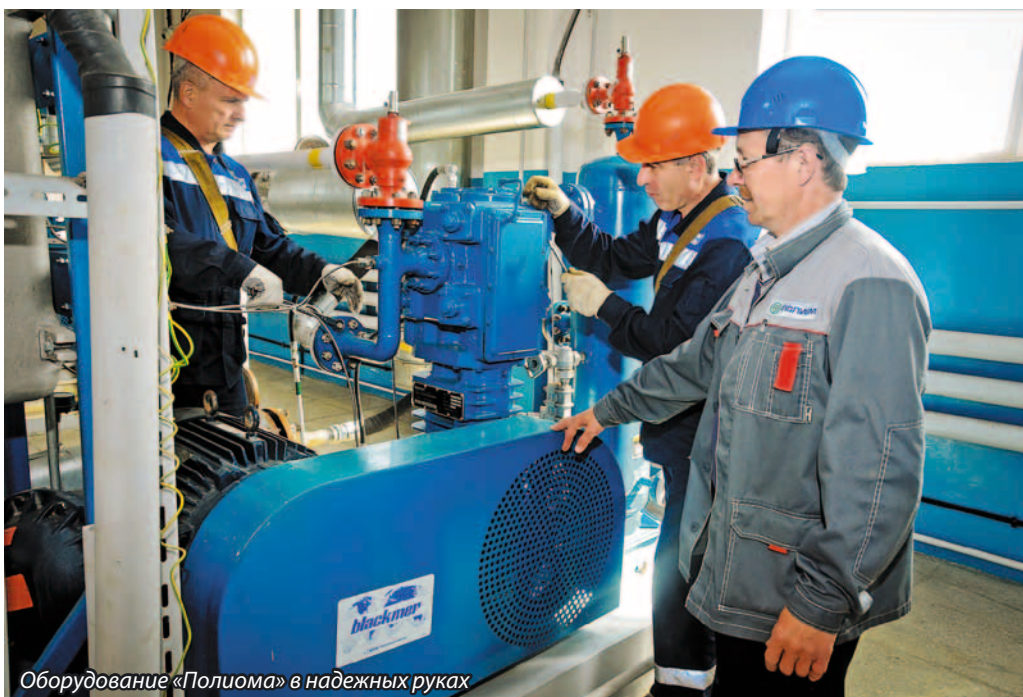
Оборудование «Полиома» в надежных руках

«Больше всего мне нравится, когда в работе все ладится и получается. Один вопрос решили, сразу на другой переключились – вот это я люблю. А