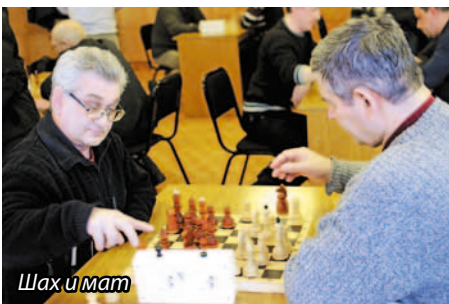
Шах и мат

17 января генеральным директором ОАО «Омский каучук» во исполнение постановления Правительства РФ от 26.06.2013 г. № 536 утверждена Политика в области промышленной безопасности. Согласно данному документу высшее руководство обеспечивает управление предприятием, эксплуатирующим опасный производственный объект, и берет на себя ответственность за реализацию данной политики, обеспечение ресурсами, необходимыми для поддержания, постоянного улучшения и развития системы промышленной безопасности.