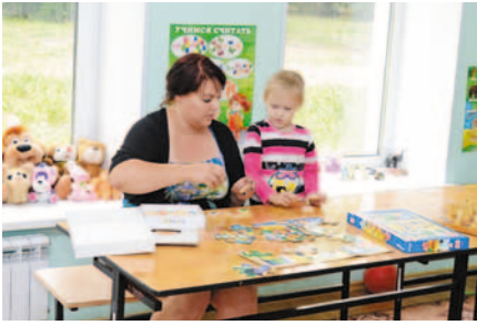
Детская комната в «Химике»