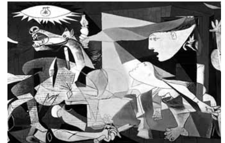
«Герника», Пабло Пикассо, 1937 год

ряного юбилея организаторы подготовили для участников богатую культурную программу и специальные подарки. Благодаря сотрудничеству с MarathonPhotos – новозеландской компанией, специализирующейся на фото- и видеосъемке спортивных соревнований, каждый бегун сможет скачать с их официального сайта свои фотографии с трассы и распечатать памятный диплом с дизайном юбилейного XXV Сибирского международного марафона и указанием персонального результата.