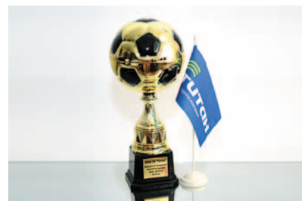
Кубок – наш!

исполнилось 19 лет со дня выпуска первой тонны метил-трет-бутилового эфира (МТБЭ). В настоящее время качество продукта соответствует мировым стандартам и отмечено престижными отечественными наградами. МТБЭ зарегистрирован в соответствии с Регламентом Европейского Союза по химическим веществам REACH.