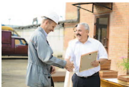
Награды – лучшим!

ГК «Титан» приняла участие в мероприятиях, посвященных празднованию 298-й годовщины со дня основания Омска, в частности, в городской экспозиции «Флора-2014» и цветочной экспозиции Советского округа. Омский завод полипропилена победил в номинации «Лучшее содержание и оформление территории коммерческой организации с численностью работников до 500 человек» традиционного городского смотра-конкурса, проведенного в рамках выставки.