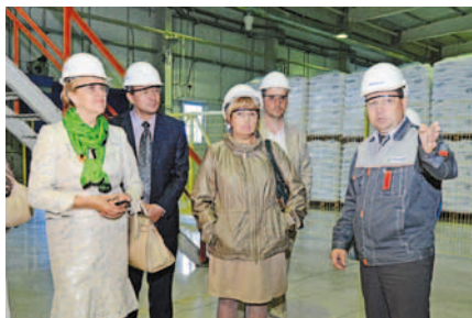
Гости на «Полиоме»