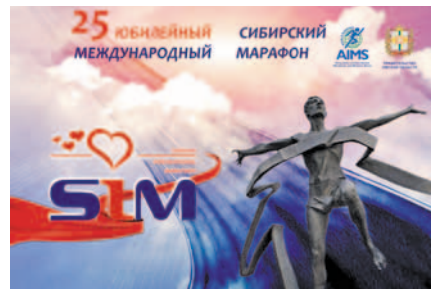
Все на марафон!

в Экспоцентре в шестой раз пройдет Международная выставка «Спорт. Молодость. Здоровье – 2014». Ее организаторами выступают Правительство Омской области, Министерство по делам молодежи, физической культуры и спорта Омской области и Агентство по рекламно-выставочной деятельности. Ежегодно выставку посещают более 15 000 человек.