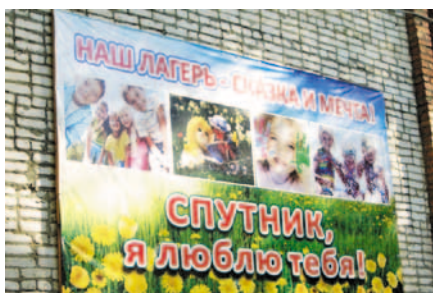
В ДОЛ «Спутник»