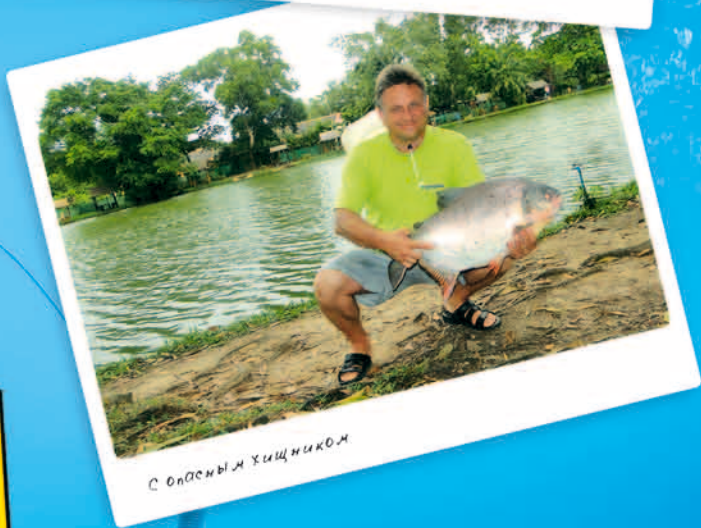
С опасным хищником