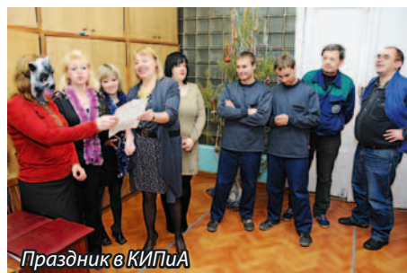
Праздник в КИПиА