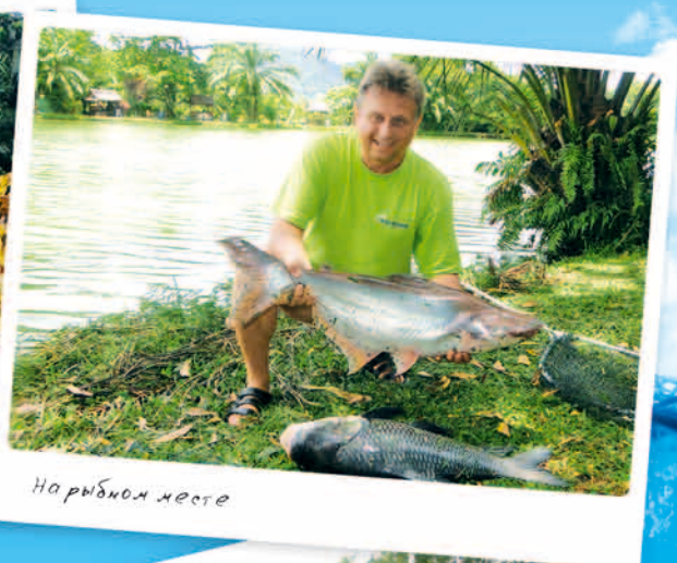
На рыбном месте