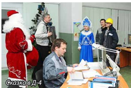
Сказка в Д-4