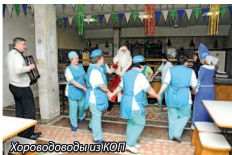
Хороводоводы из КОП