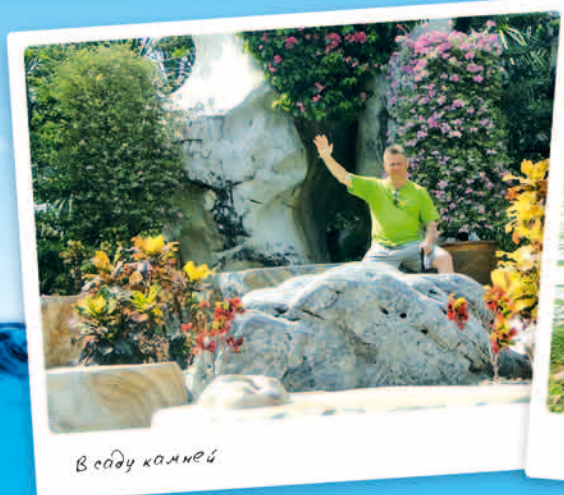
В саду камней