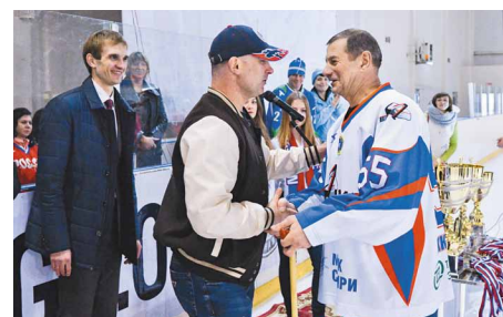
За преданность хоккею