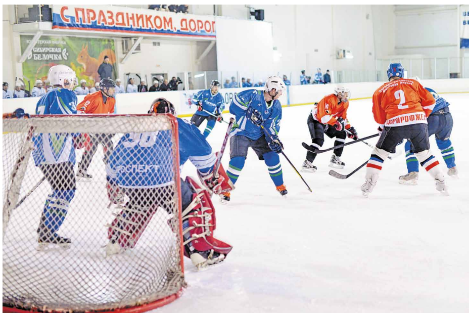
В зоне атаки