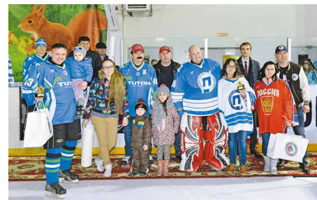
Мама, папа, я – спортивная семья