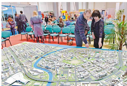
«Городская среда» на макете