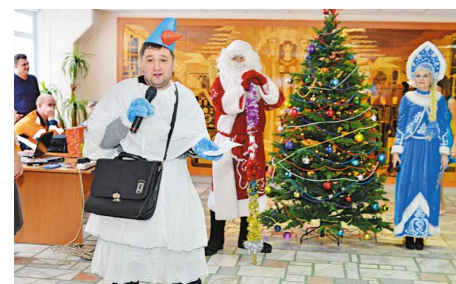
«Почтальон» на «Омском каучуке»