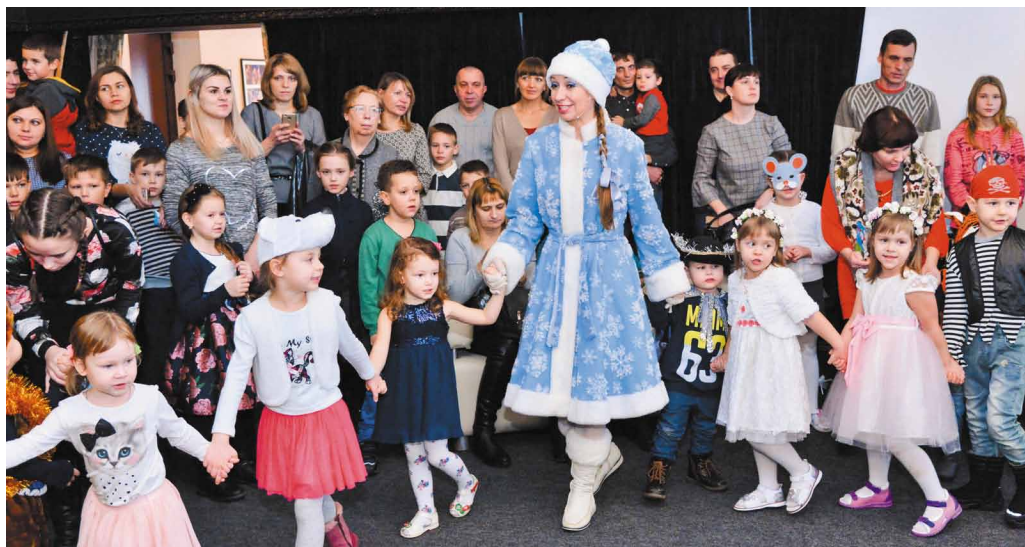
Хоровод со Снегурочкой в «Пятом»