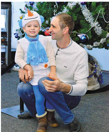
А кто это в ярком костюмчике?