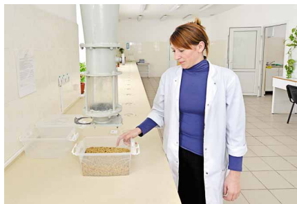
В визировочной лаборатории

В производственно-технологическую лабораторию комбикормового завода «Пушкинский» (ОП ООО «Титан-Агро») поступило новое оборудование – еще один современный инфракрасный анализатор.