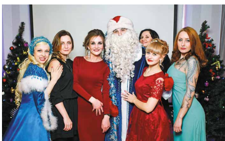
Праздник в «Титан-Агро»