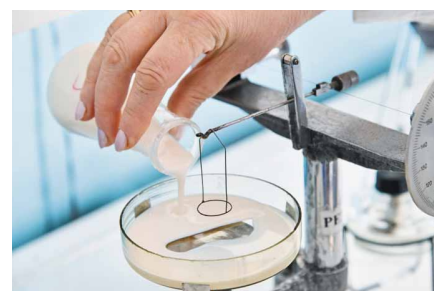
Омский синтетический латекс

участка цеха водоснабжения и водоотведения, ответственные за изготовление и монтаж трубопроводов, смонтировали более 5 км водных сетей. Участок обеспечивает продукцией и другие предприятия, входящие в ГК «Титан»: комбикормовый завод «Пушкинский» и свиноплекс «Петровский» (ООО «Титан-Агро»).