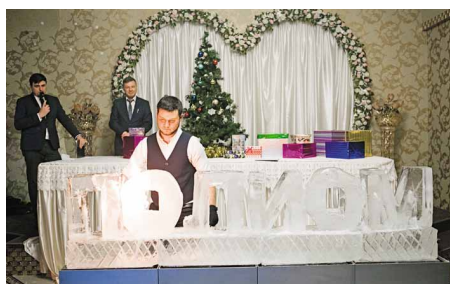
Работает мастер по льду