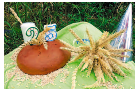
С днем рождения, «Титан»!