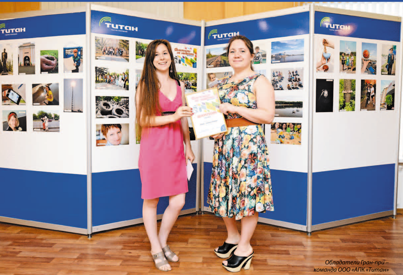
Обладатели Гран-при – команда ООО «АПК «Титан»