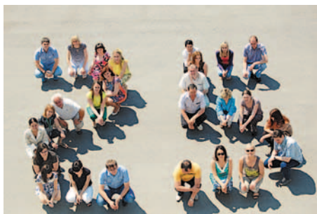
«Титану» – 25!