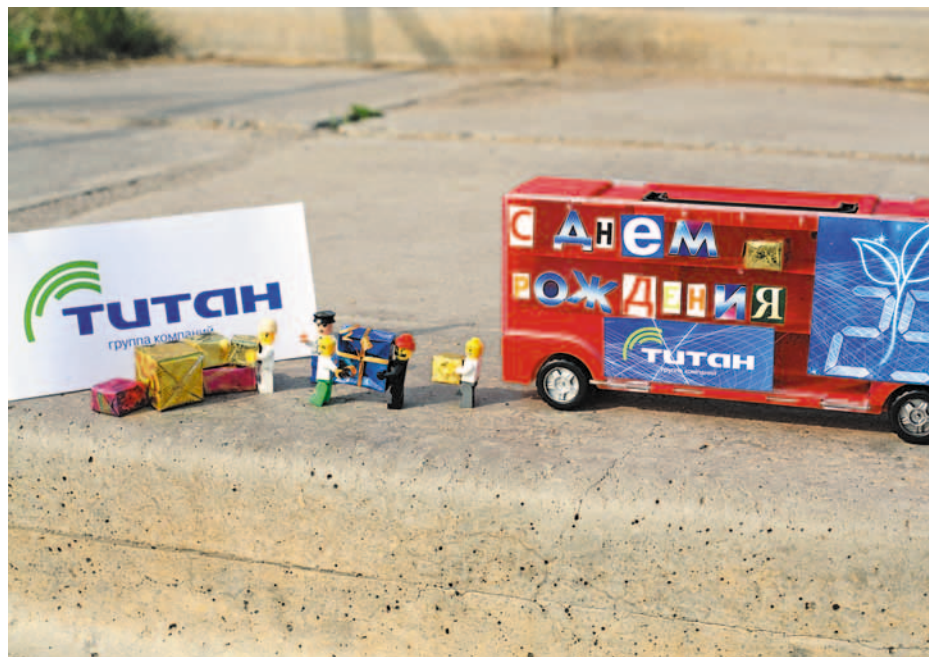
В кадре – «Титан»!