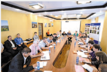
В ходе совещания